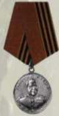
МЕДАЛЬ ОРДЕНА "ЗА ЗАСЛУГИ ПЕРЕД ОТЕЧЕСТВОМ" 1 И 2 СТЕПЕНИ